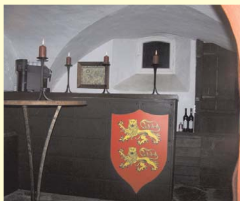
Gewölbebar im ehemaligen Burg-Verlies

Lassen Sie sich in die vergangenen Jahrhunderte zurückversetzen und genießen Sie Ihre private Feier.