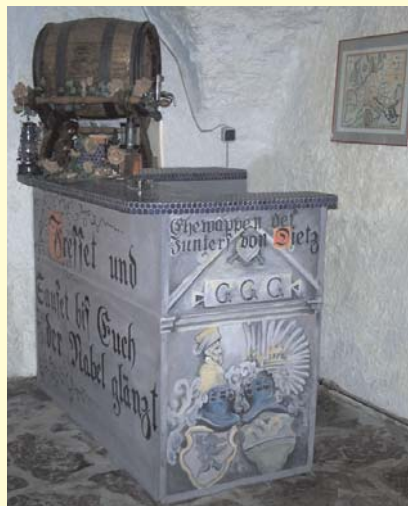
Theke im Hauptgewölbe mit Ehwappen des Junkers von Diez