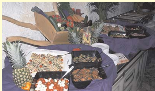
Lucullischer Genuss von rustikal- bis zum Hochzeitsbuffet